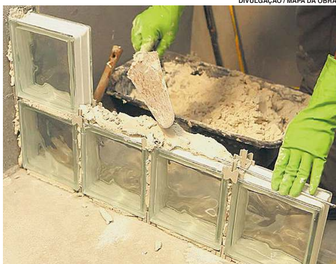
A aplicação requer cuidado para não comprometer o projeto