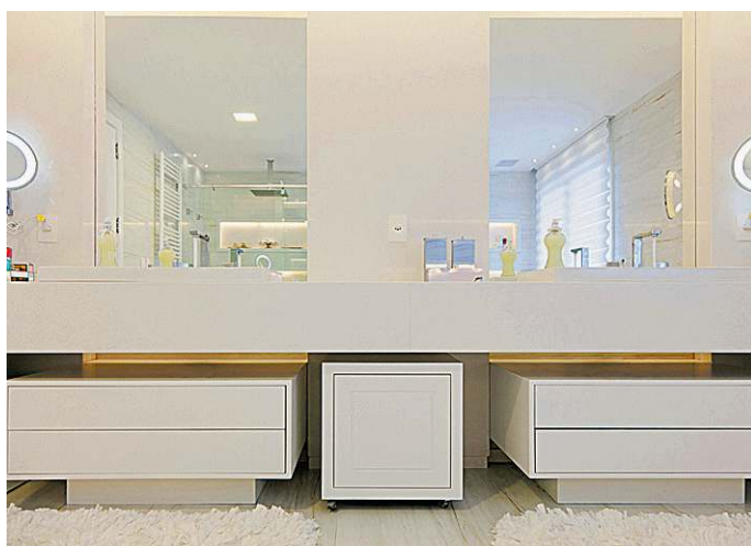
O banheiro do casal tem duas cubas na bancada e revestimentos que remetem ao mármore