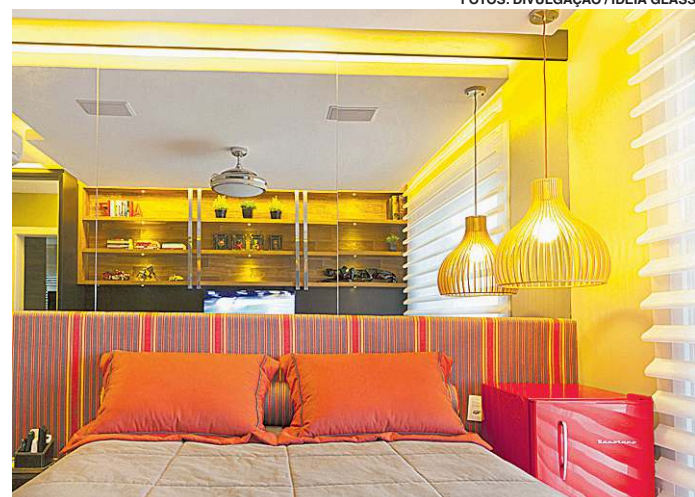
O quarto do filho recebeu um pouco mais de cor, com destaque para o frigobar vintage (dir.)