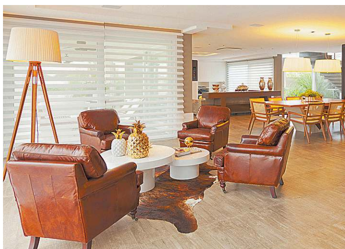
As cores quentes foram utilizadas apenas em detalhes, como nas poltronas da sala